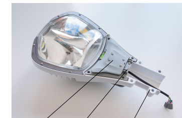
Рисунок 2. Схема установки светильника на кронштейн.